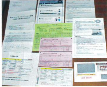
【新型コロナウイルス感染者の状況内訳】(令和3年7月1日現在)