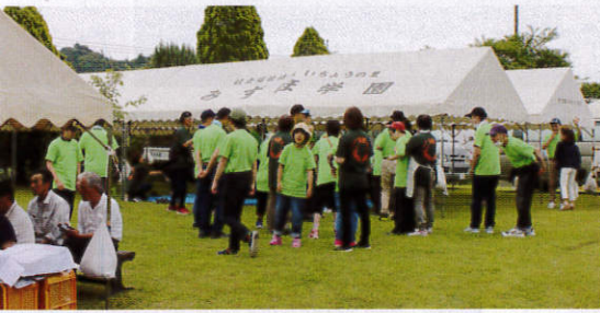
みずほブース大繁盛