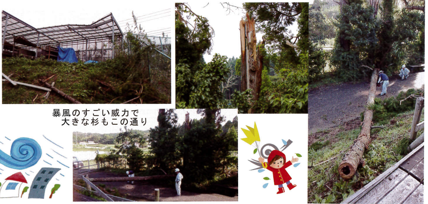
暴風のすごい威力で 大きな杉もこの通り