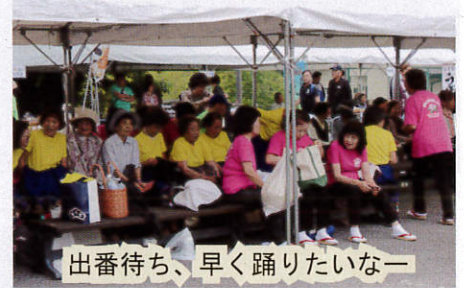
出番待ち、早く踊りたいな