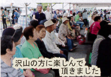
沢山の方に楽しんで 頂きました