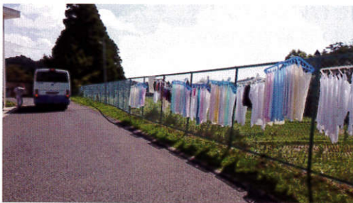
洗濯機・乾燥機が使えないので、手洗い・天日干しお天気が良くて助かりました。