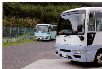
大停電の中、熱中症を防ぐため大活躍した、新旧のこんた号。手前が旧こんた号、奥が新こんた号です。ありがとう。