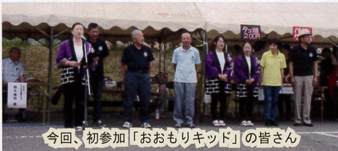
今回、初参加「おもりキッド」の皆さん