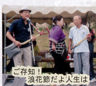
ご存知！ 浪花節だよ人生は