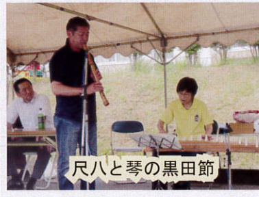
尺八と琴の黒田節