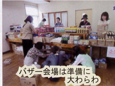
バザー会場は準備に 大わらわ