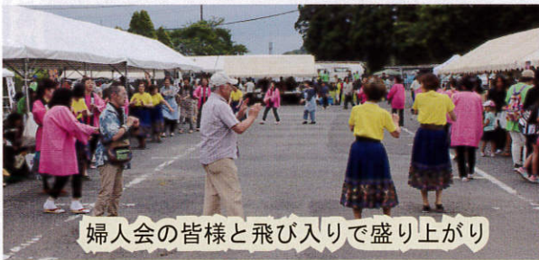
婦人会の皆様と飛び入りで盛り上がり