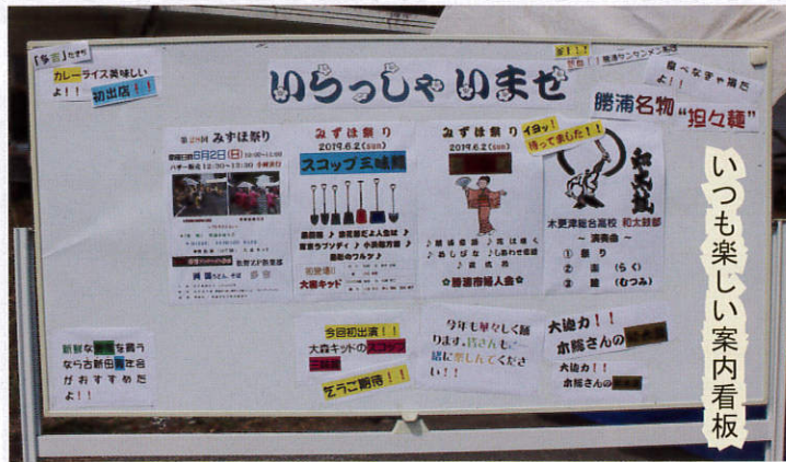
いつも楽しい案内看板