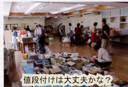
値段付けは大丈夫かな？