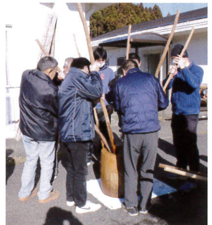
はじめは皆で つねつねつね