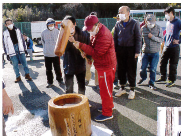
もちつき楽しいなー