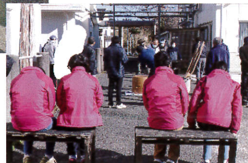
あったかくてイイなー まだかなー