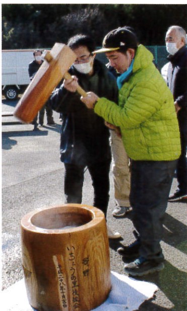
ウスはもっと右だよー