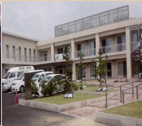
さがみ野ホーム(全景)