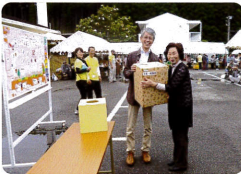
お楽しみ抽選会(賞品授与)

みずほ学園のご利用者・ご家族・地域の協力団体・職員達が心のこもった「おもてなし」が出来るように準備から開催まで行いましたが、なにより、雨の降る中、多くのお客さまにお越し頂いたことに感謝してもしきれない感動がありました。