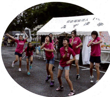
ドリームキッズ(ダンス)

今年の「みずほ祭り」は、娘も好きな物をたくさん食べて、ニコニコ...とても嬉しそうでした。親子共々楽しい時間があったという間に過ぎてしまい一日が終わりました。どうもありがとうございました。