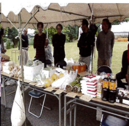
古新田会青年会販売ブース