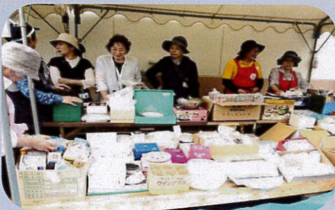
ボランティアの皆様