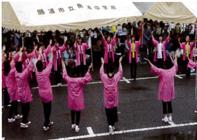
勝浦市婦人会踊り

社会福祉法人いちょうの里は、平成元年に法人認可を得て、平成二年六月入所施設創業開始し、措置制度のもとで行政から委託され運営してきました。