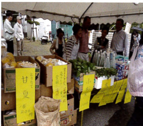
オーシャンズ若潮明社販売ブース

今回とても良いなと思ったのは、雨で濡れた服の着替えが欲しくて行った古着売り場でした。ビニール袋いっぱい三〇〇円。友達と一袋を買うことにして、一人一五〇円。管理棟の廊下での販売でしたので、ゆっくり見ることが出来ました。「袋いっぱい」この言葉につられて、ついつい沢山の買い物をしてしまいました。