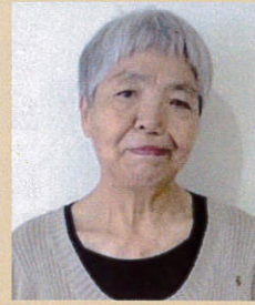
梅雨入りをまじかに控えて六月一日に神奈川県綾瀬市

にある障がい者高齢施設「さがみ野ホーム」を見学させていただきました。当ホームは、遠くには大山丹沢山塊を望み、富士山も見えるさがみ野台地であり、周辺環境は「みずほ」とは違い、市街地にありました。