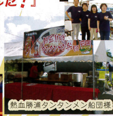
熱血勝浦タンタンメン船団様