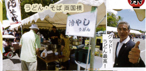
うどん・そば 両国様