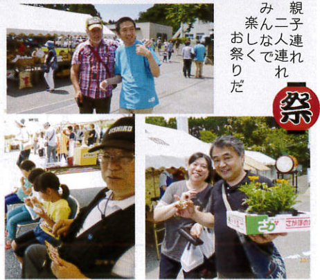
親子連れおしくでれだ