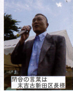
閉会の言葉は 末吉古新田区長様