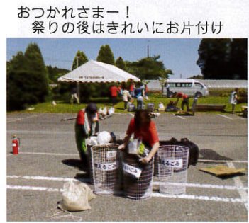
おつかれさまー! 祭りの後はきれいにお片付け