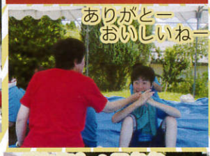
ありがとうー おいしいねー