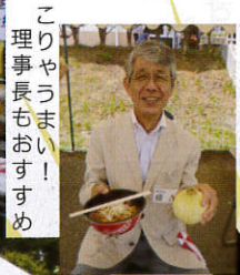
こりやうまい! 理事長もおすすぬ