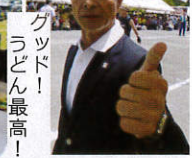
グッド! うどん最高!