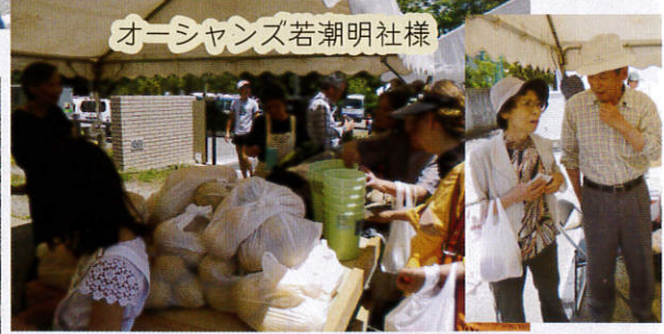
オーシャンズ若朝明社様