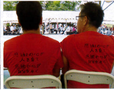
感謝の心が人を育て 感謝の心が自分を磨く