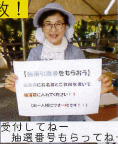
受付してねー 抽選番号もらってねー