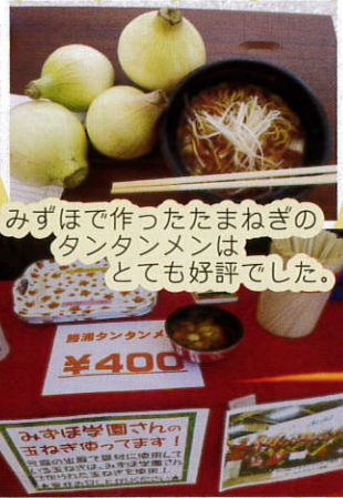
みずほで作ったたまねぎのタンタンメンは、とても好評でした。